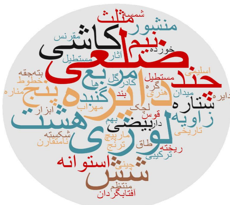
شکل ۷- ابر کلمات مربوط به تصویر اصفهان در قالب شکل هندسی